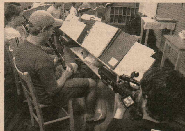
Os jovens músicos da Escola da Banda Sabbatini foram registrados em belas imagens captadas pelas lentes da equipe italiana