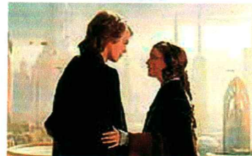
Natalie Portman, como Padmé, e Hayden Christensen, que vive Annakin no novo filme da série