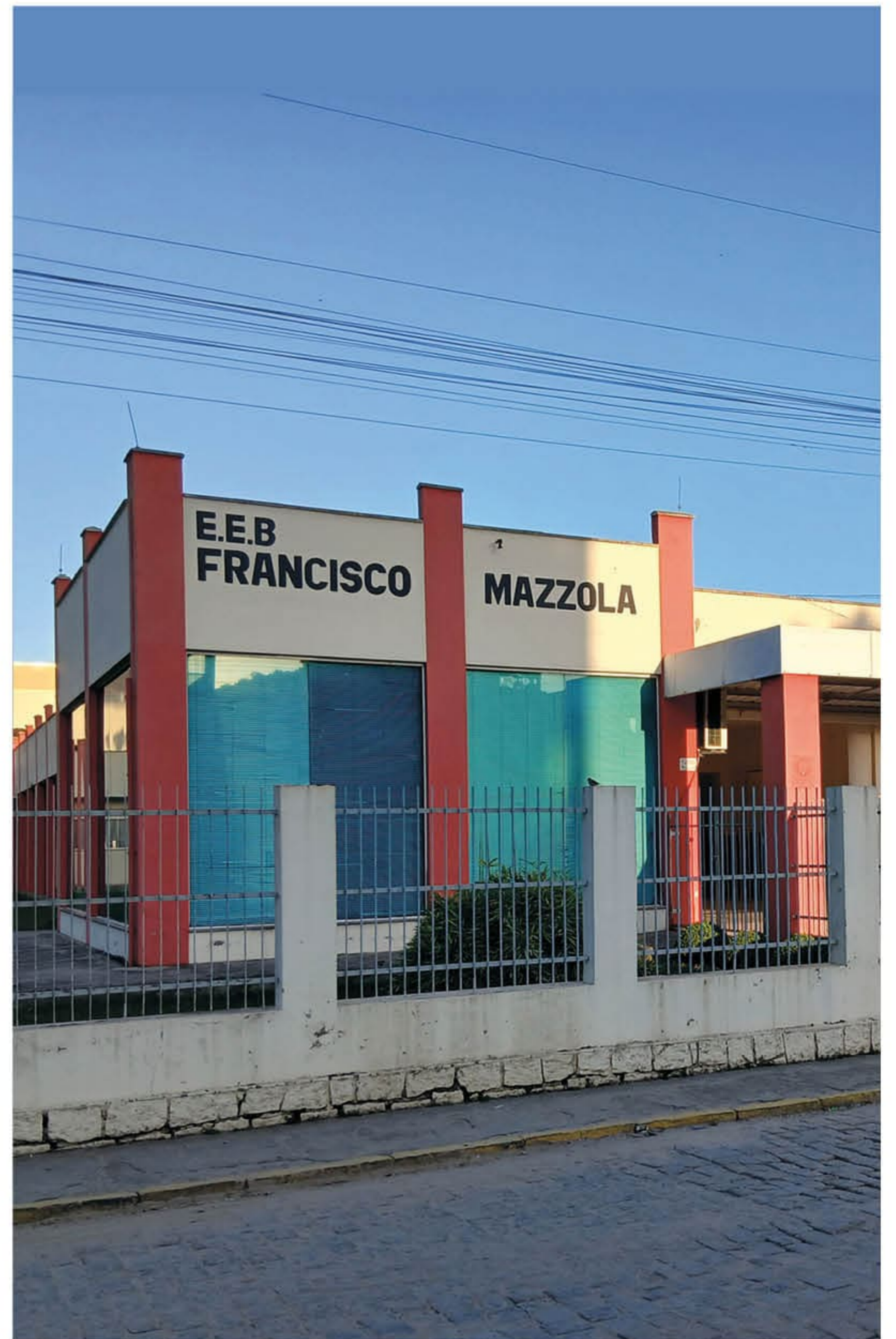
Colégio Mazzola tem 600 alunos da 1ª à 5ª série e devem ser transferidos para uma nova escola, em 2027.

outra servidora, causando possíveis danos ao erário. Enquanto durar a apuração de uma comissão especialmente designada, a servidora ficará suspensa preventivamente de suas funções, sem prejuízo de vencimentos, pelo prazo de até 30 dias, conforme permite o regime legal aplicável, prorrogável por igual período, se necessário.