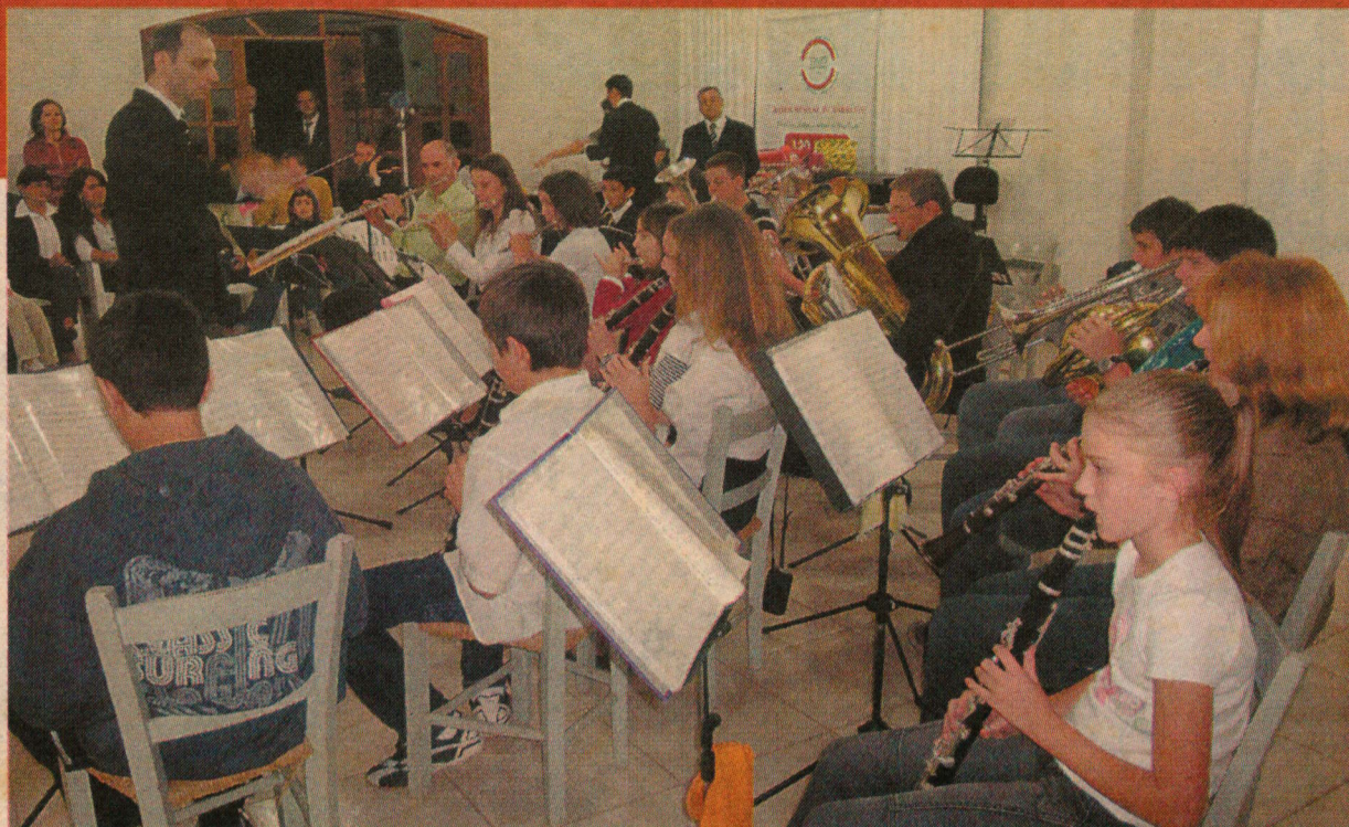
Banda Mirim já faz apresentações. Nela reside o futuro da entidade.

Nos seis itens dos chamados "Estatutos Gerais" da sociedade filarmônica estavam escritos os rígidos deveres dos sócios, de quem, logo de cara, "se exigia o máximo empenho a fim de conciliar à inteira sociedade a estima e o respeito devido à civilidade e à honra". Não se admitia como sócios aqueles de quem se poderia temer "algum motivo de desordem e desonra".