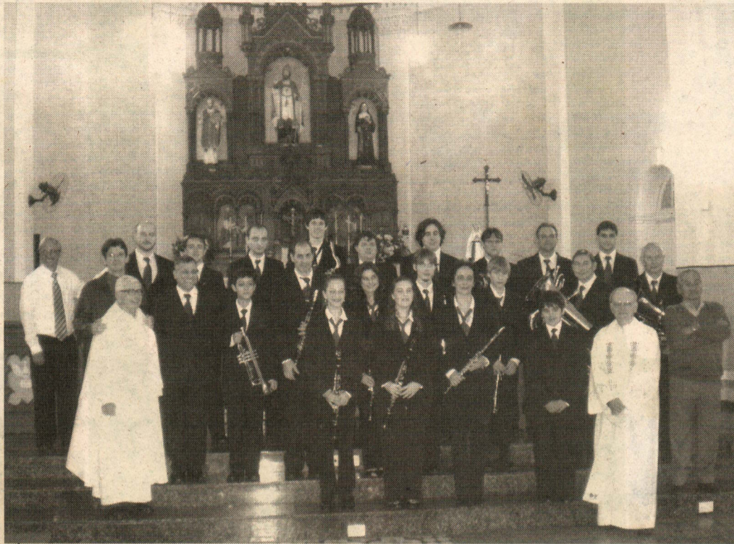
Foto histórica: Banda reunida nos 120 anos da primeira apresentação, junto a padres jesuítas, os grandes incentivadores da criação da filarmônica