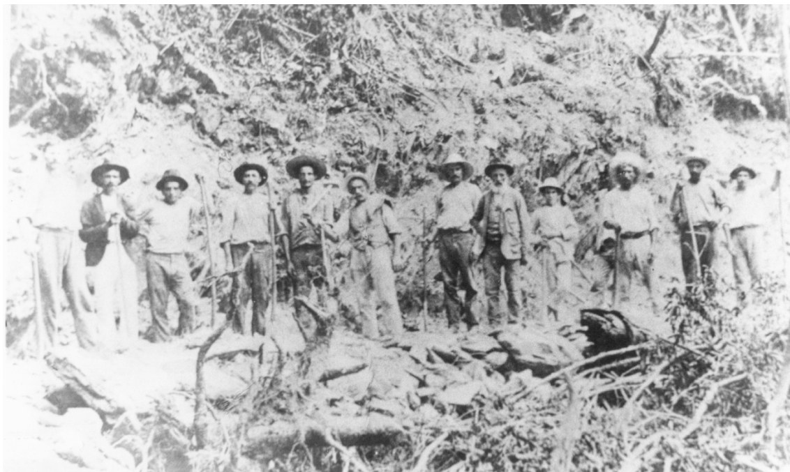
Figura n.9: Abertura da estrada da Colona.

O início do incidente começou com o telegrama circular do Presidente da Província ao Diretor das colônias Itajaí e Príncipe Dom Pedro, em 4 de outubro de 1877: