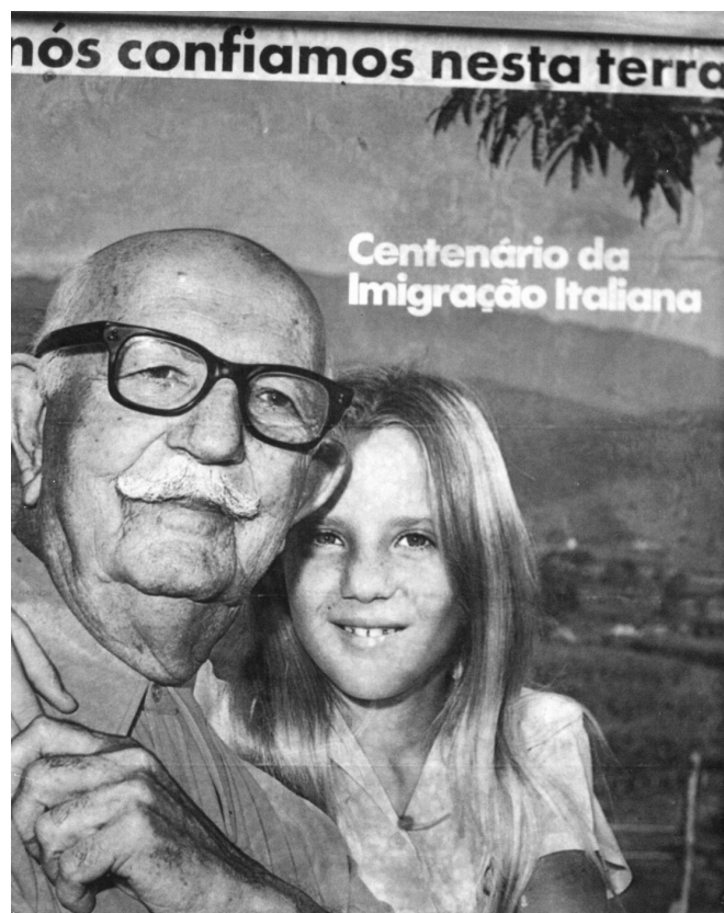
Figura n.2: cartaz comemorativo ao centenário da imigração italiana em Nova Trento.