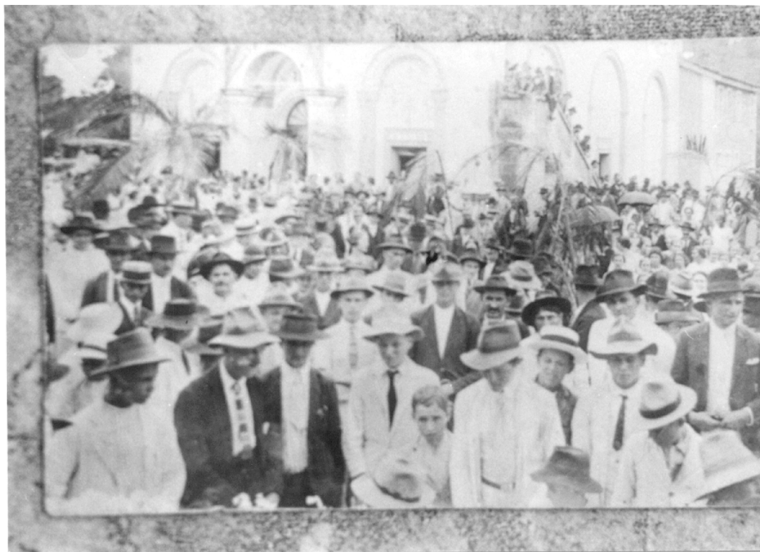
Figura n. 4: Procissão de frente a igreja do Sagrado Coração, centro de Nova Trento.

uma festividade (procissão ?) defronte a antiga igreja matriz e um casal de agricultores fotografados na década de 1920.