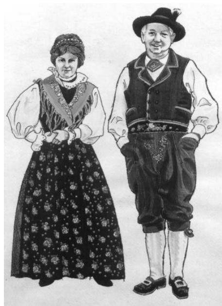
Grupo folclorístico de Mezzano Primiero