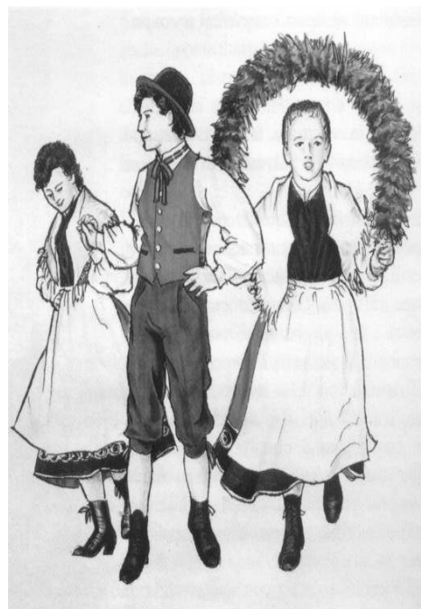
Crianças do Grupo Folclorístico