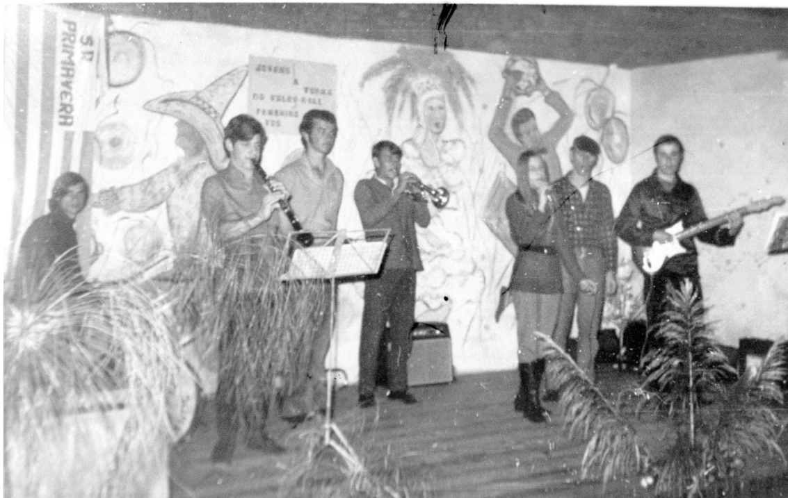
Figura n.6. Os Italianinhos.