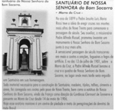
Figura n.8. Folder Turismo da Fé.

No intuito de atrair turistas, informações superficiais e um tanto forçadas foram veiculadas sem muito cuidado, como esta divulgada pelo Diário Catarinense que descreve um cardápio típico estranho para a região: