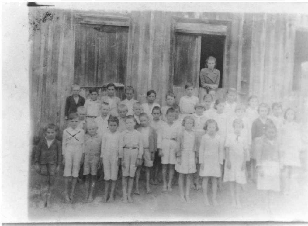
Figura n.10. Alunos da escola do distrito de Claraiba, Nova Trento.(década de 1930)

Observe-se que o prédio escolar era de madeira. Os pés descalços e as roupas apertadas, já não servindo mais nos corpos das crianças em fase de crescimento chamam a atenção. Mesmo assim, eram os bons tempos que ficaram guardados na memória da professora.