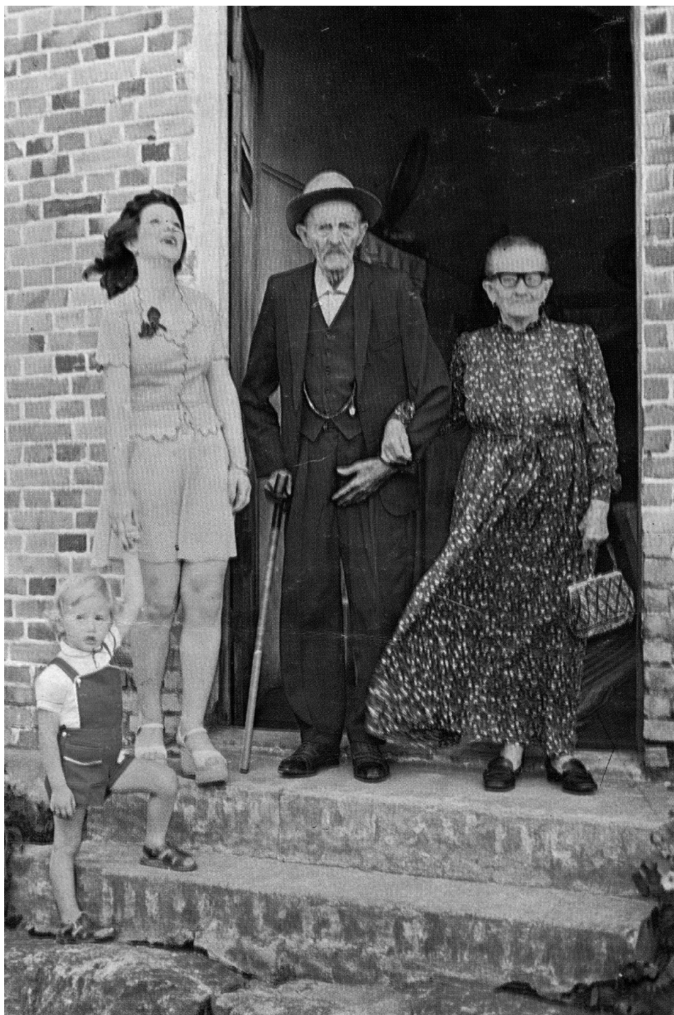
Figura n.1: cartaz comemorativo ao centenário da imigração italiana de Nova Trento, Rio dos Cedros e Rodeio.