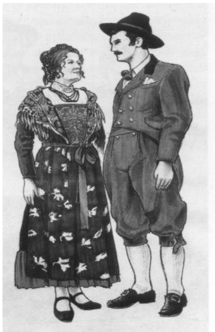
Grupo folclorístico de Carandio -Valle di Fiemme