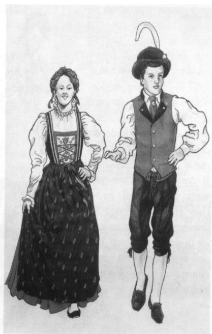
Grupo Folclorístico de Cavalese di Peio Val di Fiemme